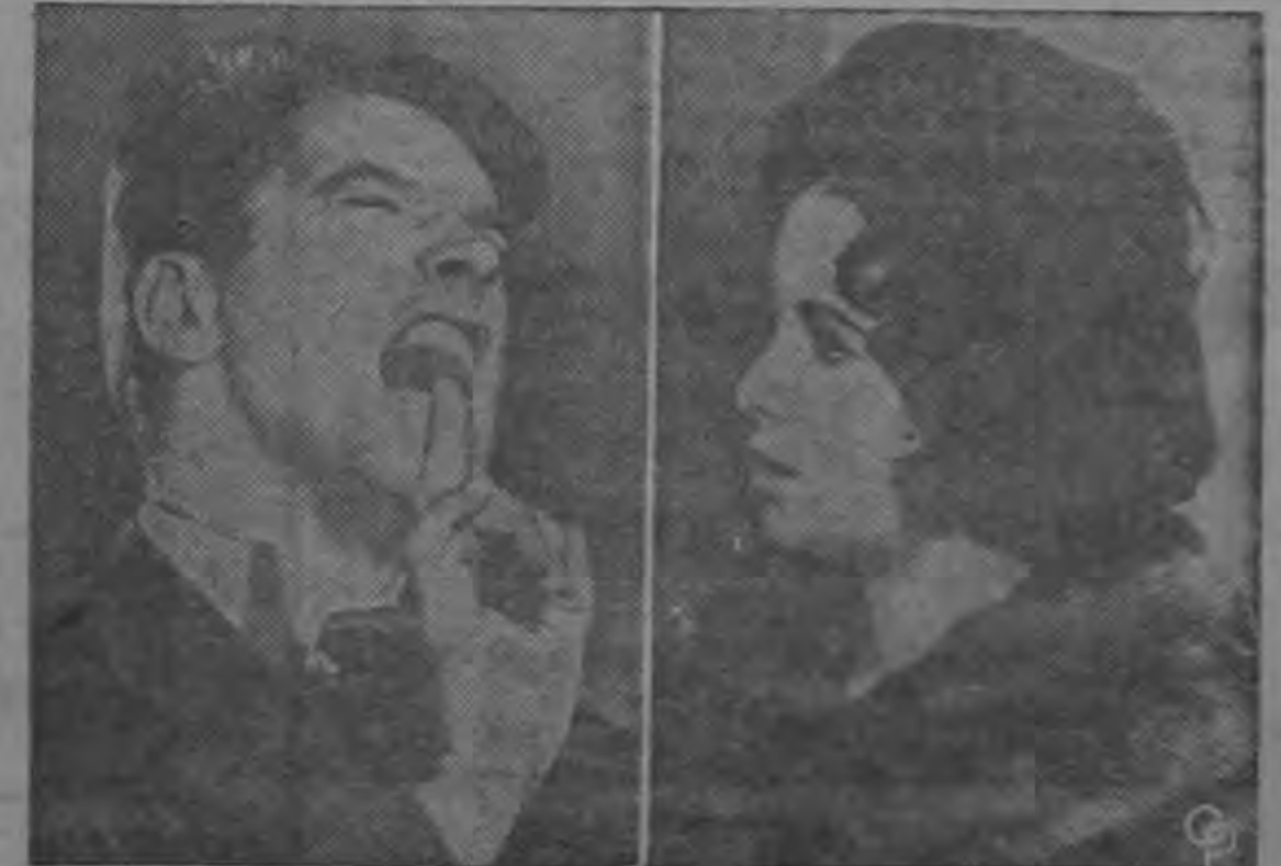
ESCOGIDA COMO LA MEJOR — La actriz cinematográfica Elizabeth Taylor y el actor Burt Lancaster han sido seleccionados como "la mejor actriz" y "el mejor actor" de 1960, en una investigación efectuada entre los escritores de películas y comentaristas de toda la nación. Elizabeth —esposa del cantante Eddie Fisher— fue seleccionada por su parte en la película "Butterfield 8", y Lancaster por su papel en la película "Elmer Gantry".

No es la primera vez que un bus es embestido por un tren aquí, pero ayer sí hubiese ocurrido una tragedia.