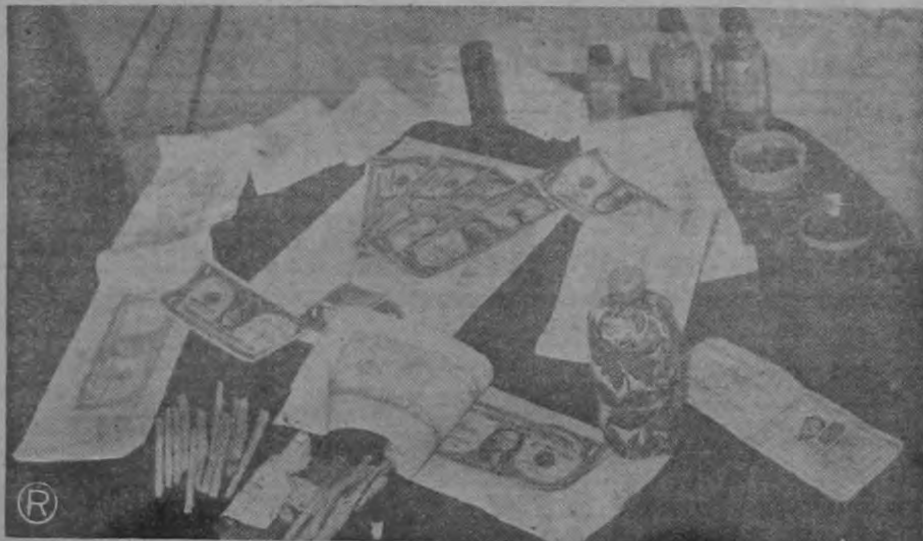
LA MEJOR FALSIFICACION HECHA HASTA EL MOMENTO ha sido la que descubrieron los detectives nacionales, y cuyos trámites finales fueron remitidos ayer al Juez Penal de Hacienda. La reproducción fotográfica arriba muestra un equipo de falsificación que aunque burdo, "había dado resultado" a unos pandilleros. Sin embargo, esa no era más que una burda labor. La última era perfecta pues los billetes tenían impreso hasta el hilo metálico.