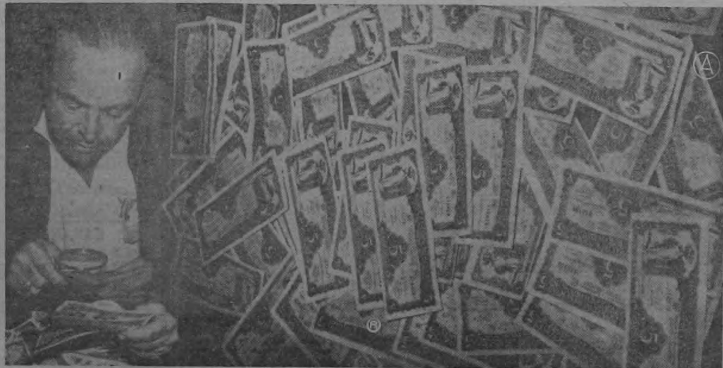
LOS PRIMEROS BILLETES FALSIFICADOS fueron salvadoreños, de a cinco colones. Parece ser que escogían determinadas denominaciones y colores así como tamaños especiales que se adaptasen a sus facilidades para imprimirlos. He aquí una foto exclusiva publicada cuando se descubrió el "racket" aquí, lo cual puso sobre aviso al gobierno y banca salvadoreña.